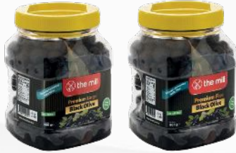
Doğal Fermente Siyah Zeytin (L) Doğal Fermente Siyah Zeytin (XS)

The Mill Zeytin serisi, doğal fermente edilmiş ve düşük tuz içerikli seçenekler de dahil olmak üzere, sizleri zeytinin zengin dünyasına davet ediyor. Bu lezzetli zeytinler PET kaplarda, cam kavanozlarda ve tenekelerde özenle paketlenmiştir. The Mill Zeytin serisi, ambalajlama çeşidine göre 24 ile 36 ay arasında değişkenlik gösteren uzun raf ömrüne sahiptir.