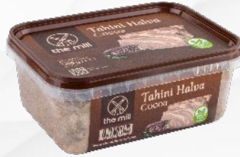
Kakaolu Tahin Helvası