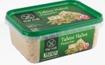
Antep Fıstıklı Tahin Helvası