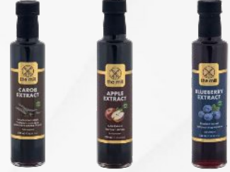
Keçiboynuzu Elma Yabanmersini

144 Koli 1.728 Adet Boyut: 80 x 120 x 178,9 cm Brüt Ağırlık: 1.023,18 kg