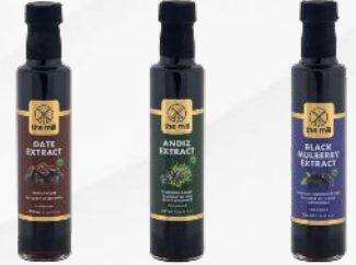
Hurma Andız Karadut