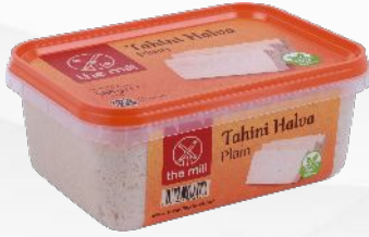
Sade Tahin Helvası

24 aylık raf ömrü ile bu lezzetli ikramı keyifle tüketebilir ve tazeliğinin korunacağından emin olabilirsiniz. Her lokma, size koruyucu içermeyen doğal susam lezzetini sunma taahhüdümüzün bir kanıtıdır.